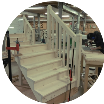
Réalisation ESCALIER, 2020