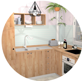
Projet CUISINE COMPLÈTE, 2020