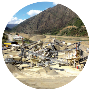
Projet INSTALL. COMPLÈTE, 2014 Budget études : 400 000 €